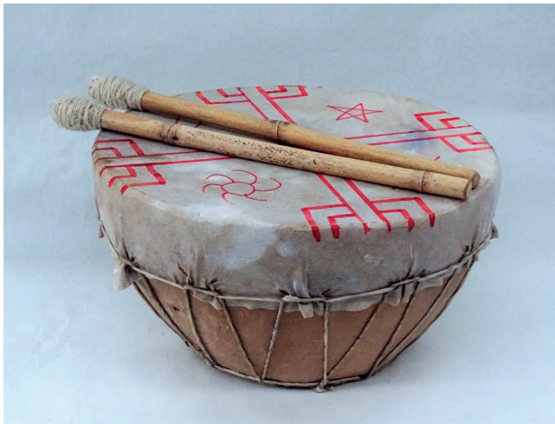
Figura 1. Kultrún . En la parte superior izquierda se representa el invierno; en la inferior izquierda la primavera; en la superior derecha el otoño; y, en la inferior derecha el verano. Imagen reproducida por los autores conforme al diseño tradicional mapuche

Para quien hizo la presentación, el kultrún prefiguraba una forma casi natural para ser convertida en un aposento. Se mostraron varios formatos y tamaños que mantenían como centro la iconografía: cuatro figuras ancestrales que representan la cardinalidad y cosmovisión mapuche. La imagen fue fetichizada, y convertida en un logo, como acontece en otros lugares no académicos. El episodio del uso o traslado de un objeto sagrado a nuestra cultura como forma comercial pasó inadvertido; el Diseño fue subsumido a cuestiones estéticas y materiales. En su defecto, fue exaltado como patrimonio pasado y no como cultura viva, cuestión que Bhabha (2002) llama un silencio ominoso, que profiere una arcaica otredad colonial.