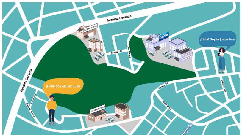
Figura 4. Pieza de difusión 1. Elaboración propia