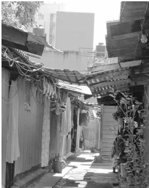
FIGURA 2. CAMPAMENTO DE DAMNIFICADOS PROVENIENTE DE LOS SISMOS DE 1985.

El Instituto de Vivienda del Gobierno del Distrito Federal pretendió (sin éxito) reubicar a la población que ocupa el campamento en otro lugar, para destinar ese terreno a la construcción de torres de departamentos para el mercado libre, en una operación financiera “sustentable”.