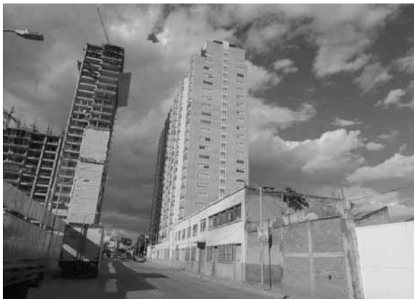
FIGURA 8. NUEVA GRANADA. EDIFICIOS POLÁREA EN “NUEVO POLANCO”.