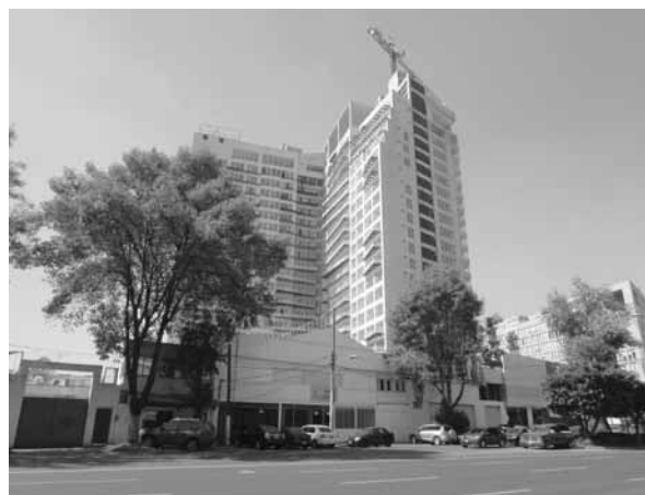
FIGURA 6. XOCO. CITY TOWERS.