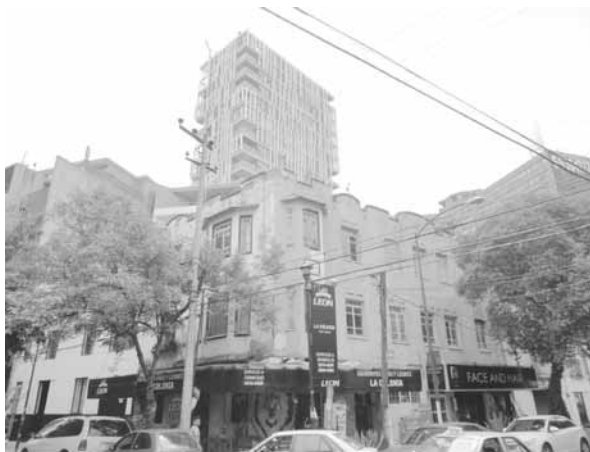
FIGURA 7. CONDESA. AL FONDO, DENSIFICACIÓN EN TORNO A VIALIDADES PRIMARIAS.