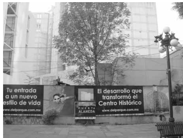
FIGURA 5. ALAMEDA SUR. ANUNCIO DE NUEVOS DEPARTAMENTOS.