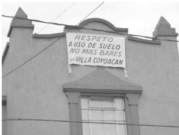
FIGURA 4. COYOACÁN. PROTESTA VECINAL CONTRA EL INCREMENTO DE BARES.